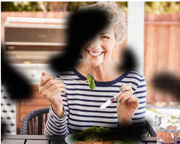
> Dunkle Flecken

Hier kommt es immer darauf an, welche Bereiche der Netzhaut betroffen sind. Wenn die Veränderungen die Makula betreffen, ist der Bereich des „schärfsten Sehens“ in der Netzhaut beeinträchtigt. Hier kann die Sehbeeinträchtigung besonders stark sein.