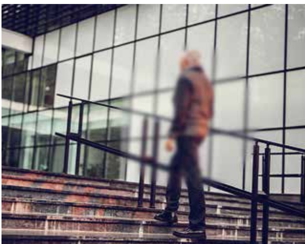
> Abnahme der Sehschärfe im zentralen Gesichtsfeld (z. B. nebelige, verschwommene oder verzerrte Bilder)