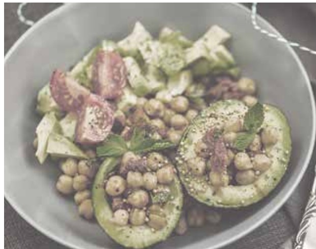
> Abnehmende Farbintensität